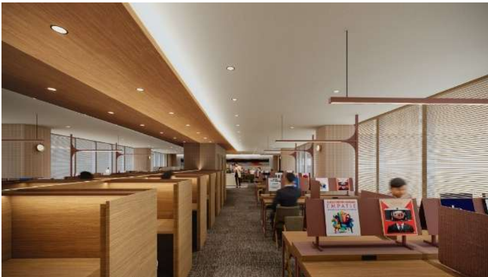
共用エリア(イメージ)